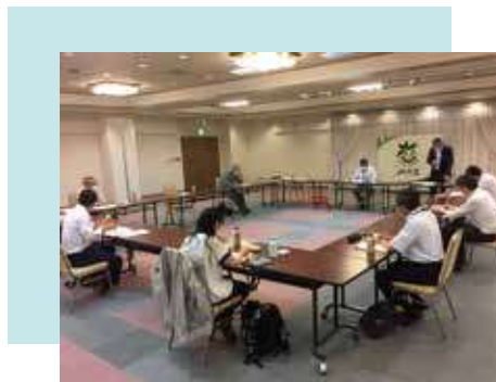
令和2年7月1日（水） 本所アプロードで開催しました